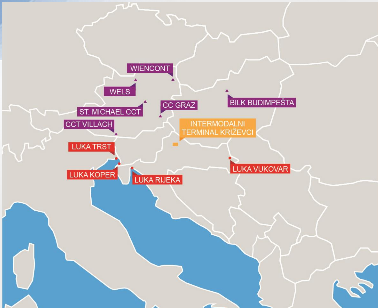
Prikaz predloženog intermodalnog terminala Križevci