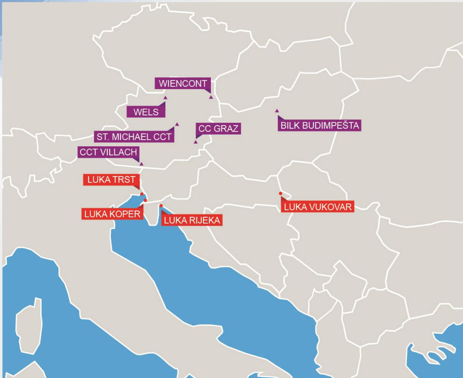
Prikaz trenutnih intermodalnih terminala u regiji