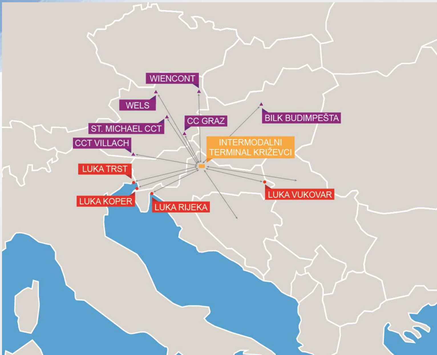
Mogućnosti predloženog intermodalnog terminala Križevci